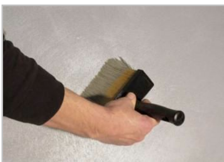
Schritt 5 - Nach ein paar Minuten ganz wenig Farbe mit dem Pinsel aufnehmen und vorsichtig über die Wand streichen, wenn Sie ein gleichmäßiges Ergebnis wünschen.