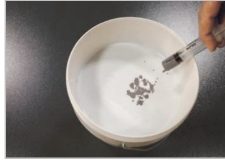
Schritt 2 - Minimal gegebenenfalls einfärben.