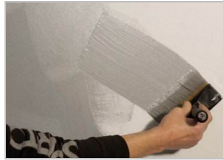
Schritt 4 - Das Produkt frei verteilen.