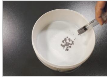
Paso 2 - Colorear Minimal si es necesario