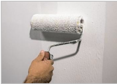
Paso 1 - Para iniciar aplica Primus Sabbia

Conservación: en un lugar seco, fresco, lejos de la humedad y las heladas.