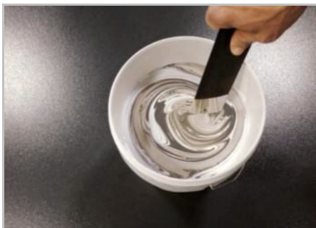
Paso 3 - Revolver bien